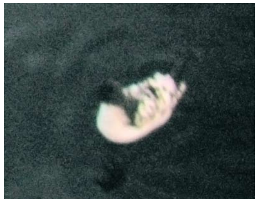
259 Smithsonian Gull / Amerikaanse Zilvermeeuw Larus smithsonianus , first-year, Sandgerði, Reykjanes Peninsula, Iceland, 2 April 2010 ( Peter Adriaens ) 260 Bonelli's Eagle / Havikarend Aquila fasciata , Skagen, Nordjylland, Denmark, 7 April 2010 ( Jørgen Kabel ) 261 Smithsonian Gull / Amerikaanse Zilvermeeuw Larus smithsonianus , second-winter, Praia da Vitoria, Terceira, Azores, 8 April 2010 ( Richard Bonser ) 262 Cape Gull / Afrikaanse Kelpmeeuw Larus dominicanus vetula (background), adult, Oued Souss, Agadir, Morocco, 12 April 2010 ( Arnoud B van den Berg/The Sound Approach ) 263 Great Blue Heron / Amerikaanse Blauwe Reiger Ardea herodias , Praia da Vitoria, Terceira, Azores, 9 April 2010 ( Richard Bonser ) 264 Cape Petrel / Kaapse Stormvogel Daption capense , Åsgard B platform, Norwegian Sea, Norway, 5 May 2010 ( Kjell Koteng )