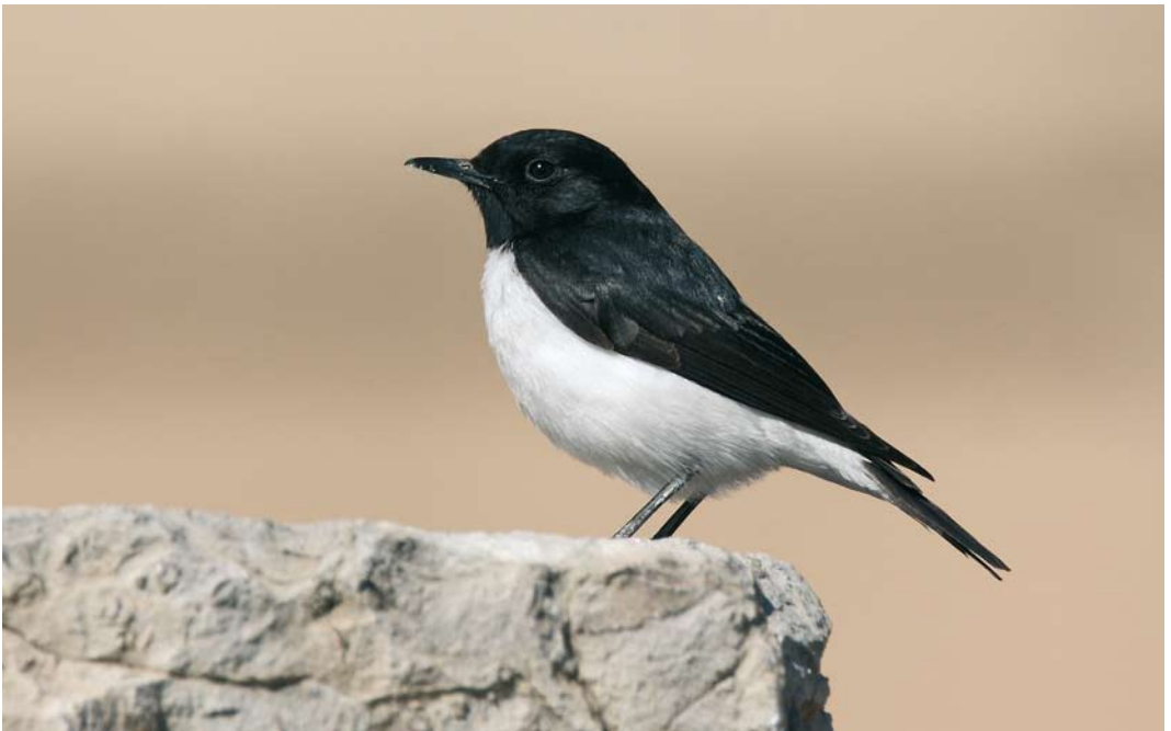
243 Hume's Wheatear / Humes Tapuit Oenanthe albonigra , Persepolis, Fars, Iran, 9 January 2009