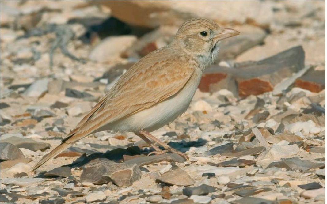
265 Arabian Dunn's Lark / Arabische Dunns Leeuwerik Eremalauda dunnii eremodites , Arava valley, Israel, 14 April 2010