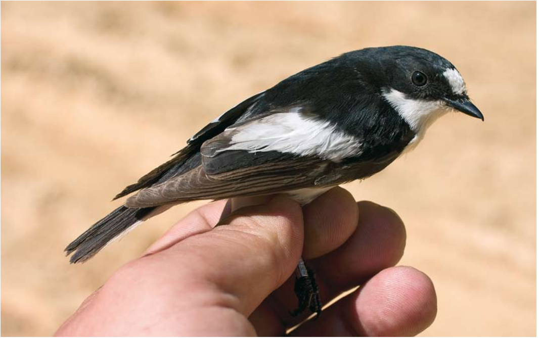
205-206 Iberian Pied Flycatcher / Iberische Vliegenvanger Ficedula hypoleuca iberiae , first-summer male, La Hiruela, Madrid, Spain, 15 May 2007. Two different birds, showing some white in tail. Also note amount of white in tertials, similar to that shown by some adult male Atlas Flycatchers F. speculigera .