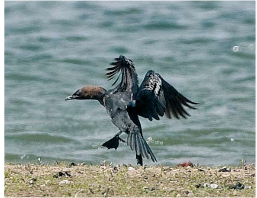
314 Dwergaalscholver / Pygmy Cormorant Phalacrocorax pygmeus , Ooijpolder, Gelderland, 16 mei 2010 (Toy Janssen)

Pas op vrijdag 14 mei werd de vogel weer gemeld toen hij om 09:40 in noordoostelijke richting over de