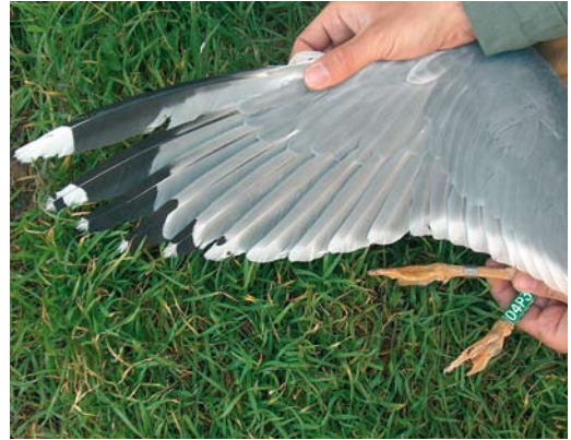
211 Herring Gulls / Zilvermeeuwen Larus argentatus , male (left) and female, Włocławek reservoir, central Poland, April 2008. Note deep yellow of bill and legs of the female, giving strong michahellis -like impression. This individual was identified by pure white tip to p10, very small amount of black between the tongue and white tip, and a large white mirror on p9 – such a combination is extremely unlikely to occur in michahellis . 212 Herring Gull / Zilvermeeuw Larus argentatus , Włocławek reservoir, central Poland, May 2007. Wing-tip of yellow-legged female. Note large amount of black on outer two primaries (p9-10) but (in this case) just small black spots on both webs of p5.

are outside of their regular range, they are faced with a lack of conspecific partners and mate with heterospecifics, or engage in homosexual relationships. They pair up with cachinnans , argentatus or hybrids between these two that make up the remaining part of the large gull population here (apart from a few rare, breeding Lesser Black-backed Gulls). Similarly, a homosexual pair recorded in Tarnów in 2000 (two michahellis females trapped at one nest) and in Jankowice in 2004 (homosexual heterospecific pair of female michahellis ringed as a chick in Italy paired with a female cachinnans ) fit the lack-of-conspecific-partners hypothesis (Betleja et al 2007).