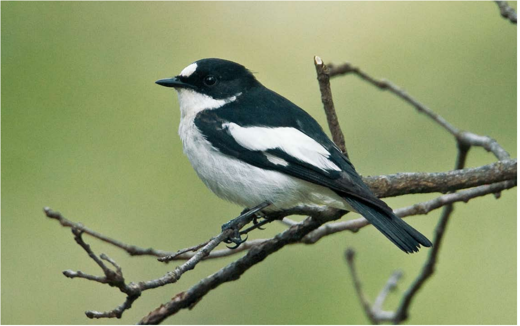
197 Atlas Flycatcher / Atlasvliegenvanger Ficedula speculigera , adult male, Ifrane, Morocco, 9 June 2009 (Rafael Armada/rafaelarmada.com). Note almost no white patch on rump, and extensive amount of white on tertials. 198 Atlas Flycatcher / Atlasvliegenvanger Ficedula speculigera , first-summer male, Ifrane, Morocco, 9 June 2009 (Rafael Armada/rafaelarmada.com). Brown primaries and primary coverts allow to age this bird easily. White in outer tail-feathers apparently absent, although this is not always easy to check without examination in the hand.