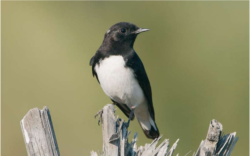
242 Variable Wheatear / Picatatapuit Oenanthe picata , between Bandar Abbas and Minab, Hormuzgan, Iran, 26 January 2009 (Arie Ouwerkerk)