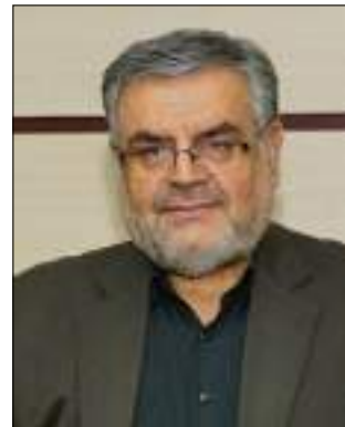
دکتر حسن ملکی

نظام پذیرش و بررسی پیشنهادات، نظام پیشرفته ای در جهت ارتقای جایگاه سازمانی و همچنین تکریم ایده های خلاقانه است؛ سازمان پژوهش و برنامه ریزی آموزشی نیز به همین منظور تقویت فرهنگ سازی براساس نظام پیشنهادات را به اجرا در می آورد. به منظور معرفی فعالیت نظام پیشنهادات در سازمان پژوهش باید اشاره کنیم که کارگروه نظام پذیرش و بررسی پیشنهادهای ریاست دکتر حسن ملکی معاون وزیر و رئیس سازمان پژوهش و برنامه ریزی آموزشی تشکیل شد.