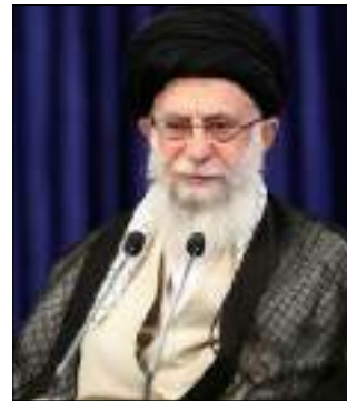
حضرت آیت‌الله خامنه‌ای (مدظله‌العالی)

رهبر معظم انقلاب اسلامی در ارتباط تصویری با مسئولان آموزش و پرورش و پرورش با بیان اینکه برنامه‌ریزی و اقدامات آموزش و پرورش پس از شیوع کرونا بی‌سابقه بود، بر ترمیم دوره‌ای سند تحول با نگاه تکمیلی، طراحی شیوه‌های جدید در فعالیت‌های پرورشی و «تربیت انسان شایسته» توسط نظام تعلیم و تربیت، جذب معلمان فقط از مسیر دانشگاه فرهنگیان و شهید رجایی و در نظرگیری مهدکودک‌ها به عنوان مراکز مهم آموزشی و پرورشی تأکید کردند.