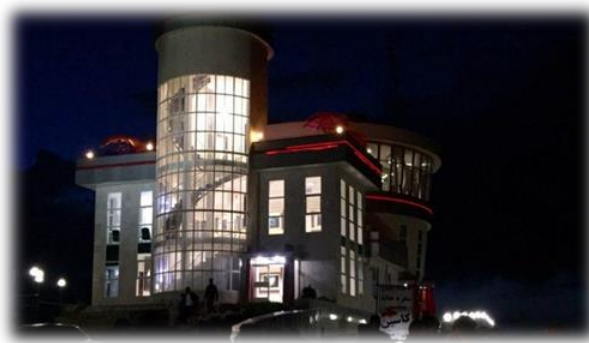
شکل ۱- بازدید از رصدخانه کاسین

این مجتمع در ارتفاع ۱۸۰۰ متری از سطح دریا و در مجتمع فرهنگی، تفریحی تحقیقاتی بام لرستان (خرم‌آباد) بنا شده و به‌عنوان یکی از مجهزترین رصدخانه‌های منطقه، دارای امکاناتی نظیر گنبد الکترومکانیکی و تلسکوپ اصلی رصدخانه (تلسکوپ مرکزی سلسترون با تمام تجهیزات ثبت و ضبط داده‌های رصدی)، دیارتمان و پژوهشکده‌های علمی، نمایشگاه عکس‌های نجومی و فناوری فضایی، آسمان‌نمای دیجیتال، سایت فناوری رباتیک، آمفی تئاتر، رستوران گردان، کافی‌شاپ و رستوران تابستانه و سوئیت‌های اقامتی است. در بازدید از این مجتمع، موضوع ثبت رصدخانه در سازمان یونسکو مطرح و مقرر گردید که در صورت ارائه مستندات، همکاری لازم در این خصوص، صورت پذیرد.