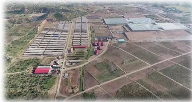
شکل ۶- بازدید از مجتمع کشت و صنعت فجر صفا