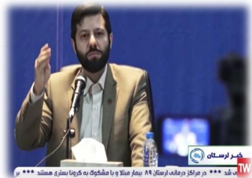
شکل ۳- سخنرانی رئیس سازمان ملی بهره‌وری ایران در جلسه شورای اداری استان لرستان