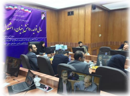
شکل ۷- جلسه کارگروه ویژه بهره‌وری استان لرستان