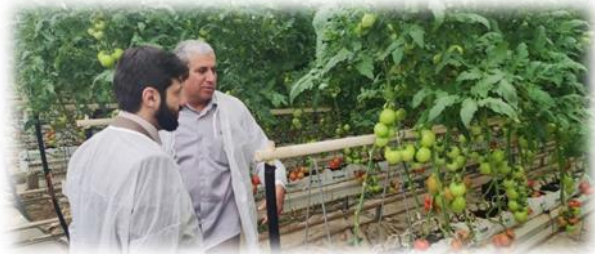
شکل ۵- بازدید از مجتمع کشت و صنعت فجر صفا

توانمندی‌های مجتمع مذکور به شرح ذیل است: