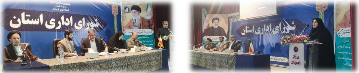
شکل ۲- شرکت در جلسه شورای اداری استان لرستان