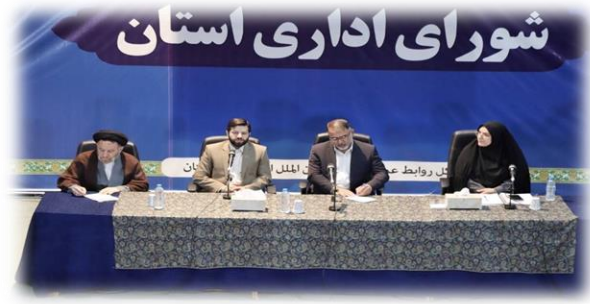
شکل ۴- امضای تفاهم‌نامه چهارجانبه در جلسه شورای اداری استان لرستان

سخنرانی حجت‌الاسلام والمسلمین آقای شاه‌رخی نماینده محترم ولی‌فقیه در استان با محوریت موضوعات ذیل ارائه شد.