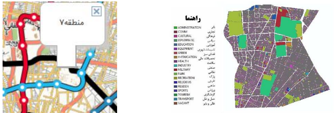
شکل ۲ نقشه کاربری زمین مرتبط با منطقه ۷