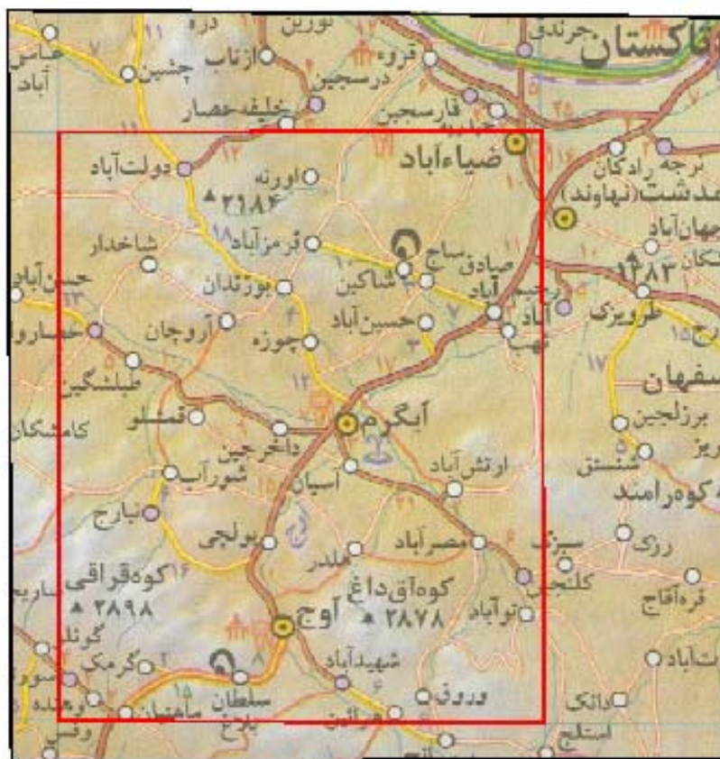
شکل ۱-۱: راه‌های دسترسی در ورقه ۱:۱۰۰,۰۰۰ آوج

ورقه یکصد هزارم آوج واقع در شمال باختری ایران و محدود بین مختصات جغرافیایی ۴۹^{\circ} ۰۰' تا ۴۹^{\circ} ۳۰' طول خاوری و ۳۵^{\circ} ۳۰' تا ۳۶^{\circ} ۰۰' عرض شمالی است. ناحیه از دو رشته کوه اصلی موازی با روند شمال باختری - جنوب خاوری تشکیل شده است: رشته کوه‌های آبگرم در شمال با بلندترین ارتفاع، ۲۵۴۰ متر، و رشته کوه‌های آوج در جنوب، که شامل بلندترین کوه‌های منطقه، ۲۹۰۰ متر هستند. در این ورقه شبکه‌های آبراهه‌ای خوب گسترش یافته است و از رودخانه‌های اصلی آن می‌توان به خررود اشاره کرد. از راه‌های اصلی ارتباطی آن می‌توان جاده آسفالت‌ته تهران - تاکستان - همدان و تهران - بوئین‌زهره - همدان را نام برد (شکل ۱-۱). در ورقه مورد مطالعه بزرگترین و مهمترین مناطق مسکونی شهرهای آوج، آبگرم و ضیاءآباد می‌باشد. این ورقه شامل ۴ برگه ۱:۵۰۰,۰۰۰ به نام‌های ضیاءآباد، آسیان، آوج و حصار می‌باشد (شکل ۱-۲).