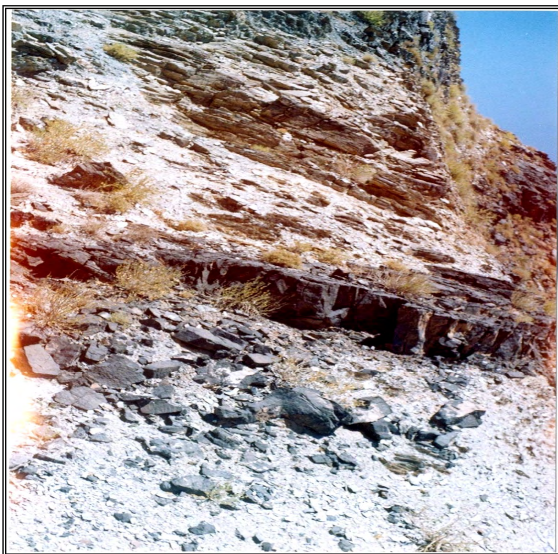
شکل ۱-۳: کانسارهای آهن جهان شیر دارای لایه بندی.

راه دسترسی به این ناحیه از طریق جاده رباط پشت بادام - جهان شیر به مسافت ۲۸ کیلومتر است. مختصات جغرافیایی این منطقه E 28^{\circ} 39' 55'' طول خاوری و 30^{\circ} 47' 32'' عرض شمالی است. سنگهای منطقه متعلق به سازند شتری (دولومیت، سنگ آهک لایه لایه خاکستری روشن) و سرخ شیل (تناوب شیل، ماسه سنگ مایل به قهوه ای روشن) و سنگهای دگرگونی سازند تاشک (اپیدوت شیست، سرسیت مسکویت شیست، آمفیبولیت، کوارتزیت) است.