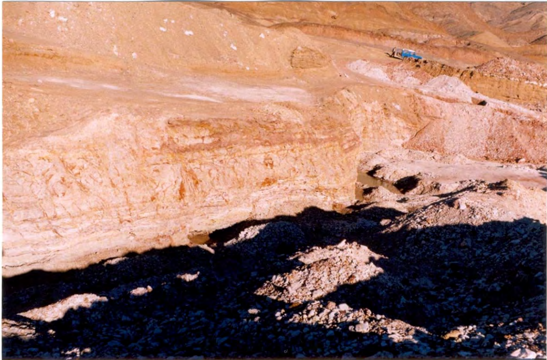
شکل ۳-۳: بهره برداری از رس توپیی جهت مصارف کاشی.