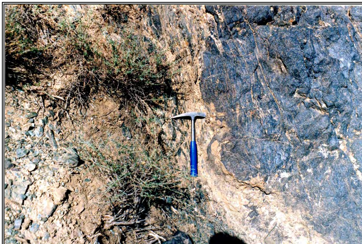
شکل ۲-۳: محل کنتاکت کانسارهای آهن با سنگهای دگرگونی شیستی در نی یو.

(نمونه های شماره 10, Z.r.9) به ترتیب ۷۹ و ۸۰ درصد است. کانسنگ های آهن دارای ناهنجاری جیوه میباشند بطوریکه عیار جیوه از ۵۵۰ تا ۶۰۰ گرم در تن متغیر است (نمونه های شماره Z.r.9, 10).